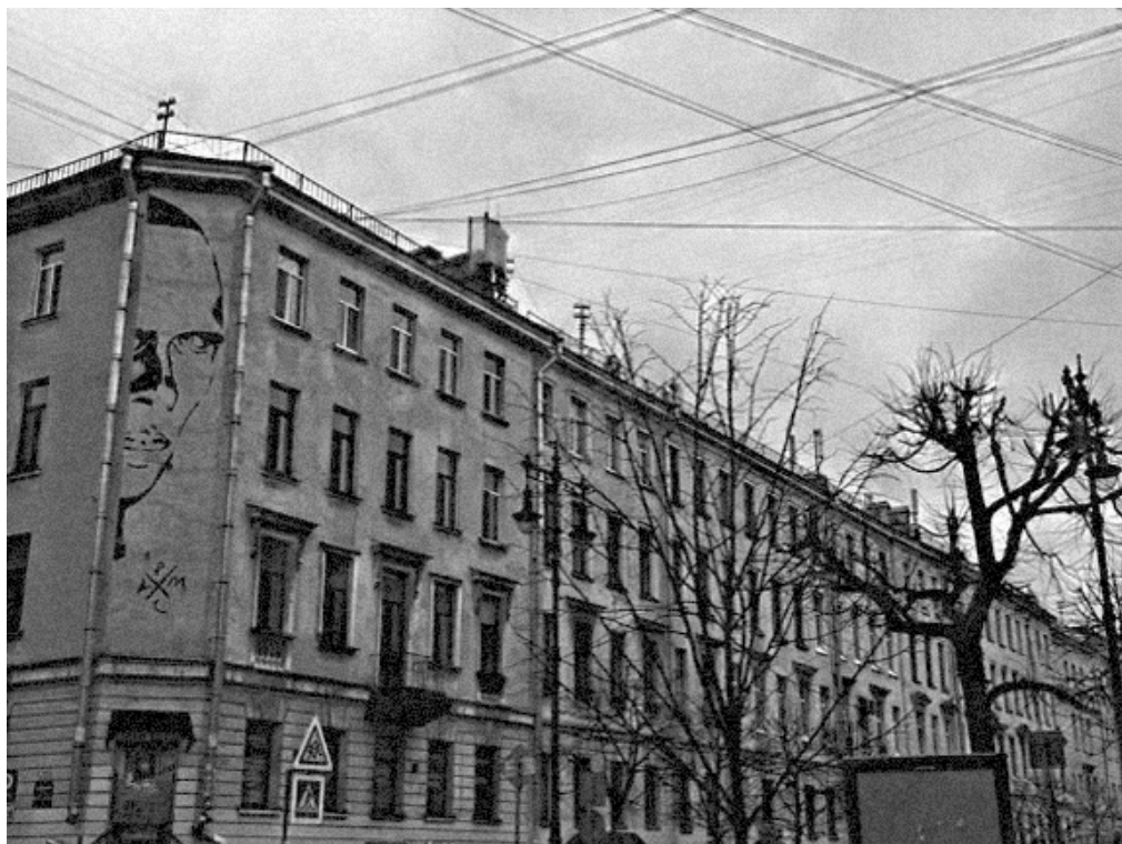
Граффити с портретом Даниила Хармса. П. Кас и П. Мокич. Мурал на фасаде дома на ул. Маяковского, 11. Февраль 2016 г. – 4 июня 2022 г.

В этом доме (Надеждинская ул., 11) в квартире № 8 Д. Хармс жил с 1925 г. до ареста в 1941 г. В квартире Хармса часто собирались поэты-обэриуты. Музея Хармса не существует. Коллекция рукописей и мемориальных вещей, основу которой составляют материалы, сохраненные Я. С. Друскиным, в настоящее время принадлежит издательству «Вита Нова». Она экспонировалась в 2013 г. на выставке «Случаи и вещи. Даниил Хармс и его окружение» в Литературно-мемориальном музее Ф. М. Достоевского.