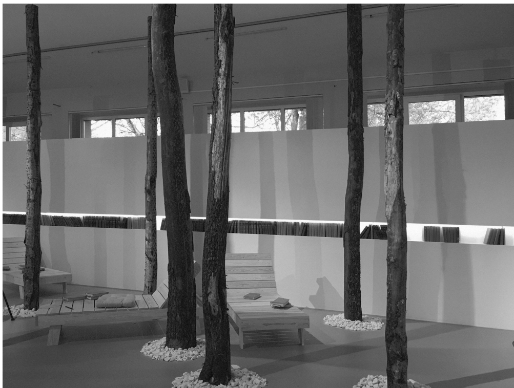
Выставка-погружение «Аникушин/Чехов». Мемориальная мастерская М. К. Аникушина – филиал Музея городской скульптуры. 22 декабря 2021 г. – до ноября 2022 г.

Выставка представляет развернутую сценографическую и документальную интерпретацию истории создания М. К. Аникушиным памятника А. П. Чехову для Москвы. 37 лет работы над образом Чехова, которая осталась незавершённой.