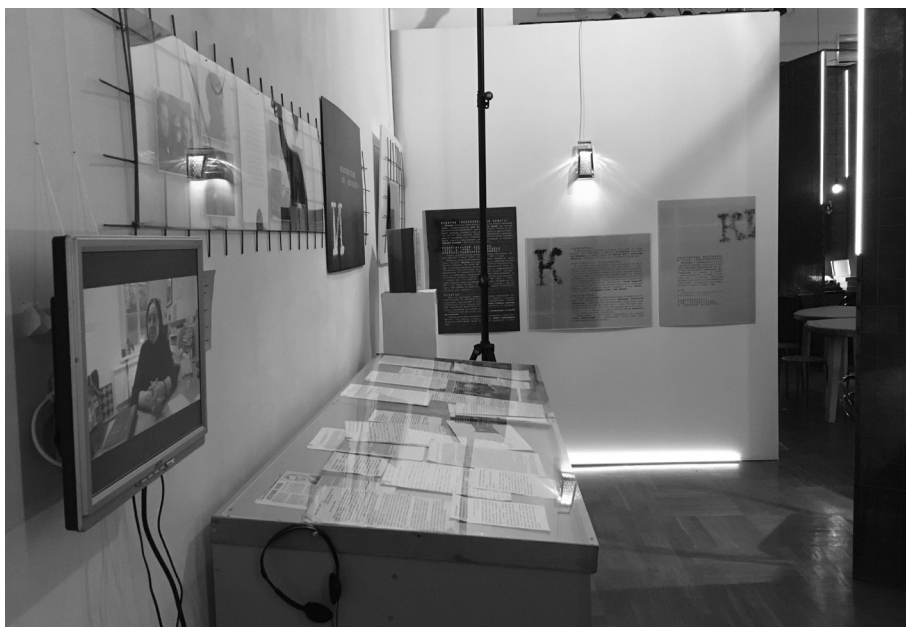
«Эрика берет 4 копии». Интерактивная выставка из цикла «В предлагаемых обстоятельствах». Государственный литературно-мемориальный музей Анны Ахматовой в Фонтанном доме. 28 октября – 11 декабря 2022. Концепция и художественное решение – Э. Б. Капелюш.

Выставка посвящена феномену самиздата 1950–1980-х гг. В название вынесена строчка песни А. Галича «Мы не хуже Горация» о творцах неподцензурной литературы. Эрика – марка популярной в данный период пишущей машинки, – обыгрывалась на экспозиции как собирательный женский образ музы, поэтессы, актрисы, который олицетворяла фотография, использованная в экспликации и видеоинсталляции. Лейтмотив выставки, обращенной к молодежной аудитории, обозначен в ее экспликации: «Предлагаемые обстоятельства меняются, но потребность в территории свободы остается. И каждое поколение ищет и находит для нее свою форму». В качестве сопроводительных текстов были использованы словарные статьи, уточняющие исторический контекст и отдельные явления контркультуры и искусства андеграунда.