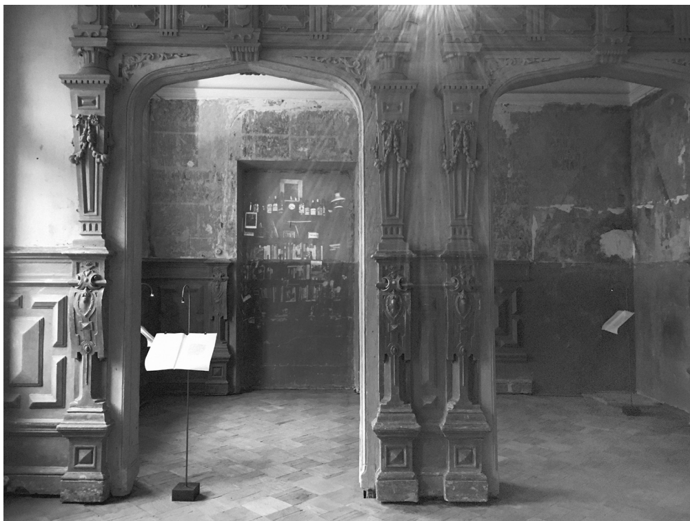
Полторы комнаты. Музей Иосифа Бродского. Музей открыт в 2020 г. в доме Мурузи (Литейный пр., д.24; ул. Пестеля, 27).

«Полторы комнаты» – жилые помещения в мемориальной коммунальной квартире, – экспонируются после работ по раскрытию элементов интерьера на 1955–1972 г., когда здесь в месте с родителями проживал И. А. Бродский.