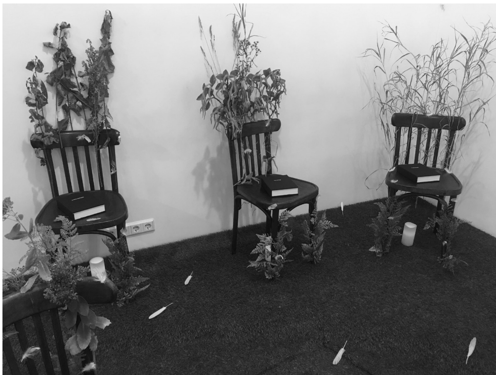
Интерактивная выставка «Ты один из моих двойников. К 130-летию А. Ахматовой», Музей А. А. Ахматовой в Фонтанном доме, 20 октября – 7 декабря 2019 г. Совместный проект музея и творческой мануфактуры «ГТХ».

Выставка была организована в рамках фестиваля «Детские дни в Петербурге» и адресована подросткам. Концептуальное решение экспозиции предполагало активную работу критического мышления и воображения, индивидуализацию музейного опыта. На выставке была представлена интерпретация ключевых моментов биографии и связанных с ними поэтических текстов А. А. Ахматовой, переведенных на язык инсталляции и дополненной реальности. Посредством приемов театральной сценографии и AR-технологий посетители становились свидетелями событий, о которых они могли получить уточняющую информацию и эмоциональное впечатление. Экспозиционный замысел был рассчитан на динамичные переходы между материальными и нематериальными, визуальными и вербальными компонентами повествования, ряд экспозиционных комплексов имел разреженный характер, представляя пространство для аудиального компонента и эффектов дополненной реальности. Предполагалось активное восприятие, прочтение и прослушивание на мобильных гаджетах текстов, представленных QR-кодами и цифровыми метками. Во время подготовки выставки были сделаны записи, на которых волонтеры из числа студентов читали стихи Ахматовой; ссылка на эти материалы была включена в выставочные инсталляции. В рамках данного проекта состоялась дискуссия кураторов, экспертов и волонтеров «На каком языке говорить с поколением XXI в.?»