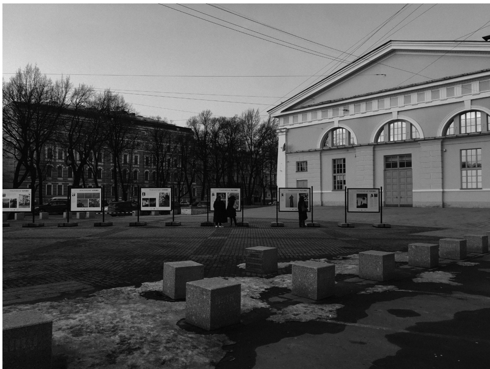
«Город – приближение – человек». Выставка на площади у западного фасада Центрального выставочного зала «Манеж». 21 марта – 17 апреля 2022 г.

Кураторский проект благотворительной организации «Ночлежка», помогающей бездомным людям. Проект включал в себя мастер-класс, проведенный в реабилитационном приюте «Ночлежки» фотографом Ю. Молодковцом. На уличной выставке были показаны фотоснимки, сделанные бездомными с помощью фотокамер, предоставленных организаторами.