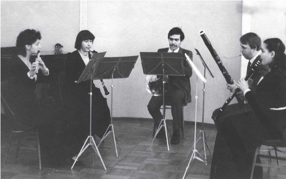
Квintет деревянных духовых инструментов в Камерном зале института