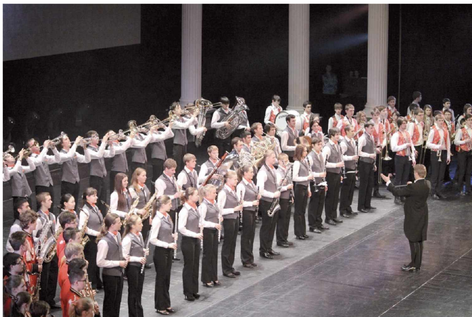
Сводный духовой оркестр в праздничном концерте