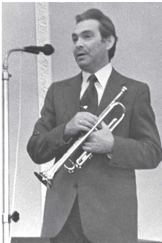
Выступление народного артиста РСФСР, профессора Т. А. Докшицера на Всесоюзном семинаре заведующих кафедрами (1981)