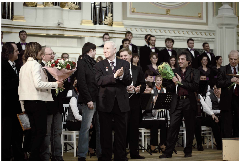
Поздравление выпускников кафедры