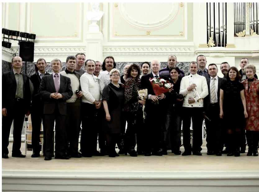
Группа выпускников кафедры (Капелла, 2012 г.)