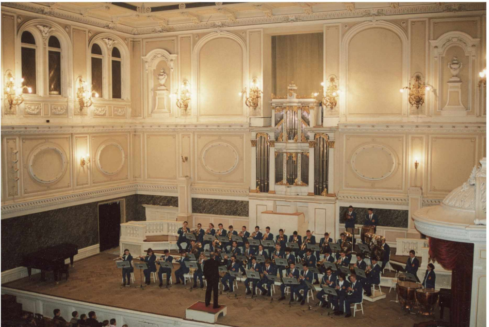
Праздничный концерт оркестра в зале хоровой Капеллы