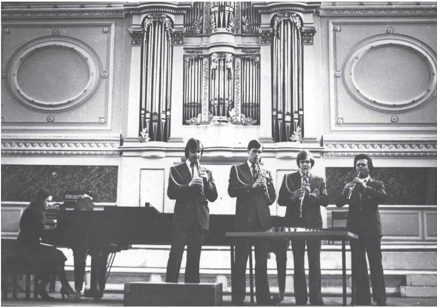
Квартет кларнетистов на сцене Петербургской хоровой капеллы