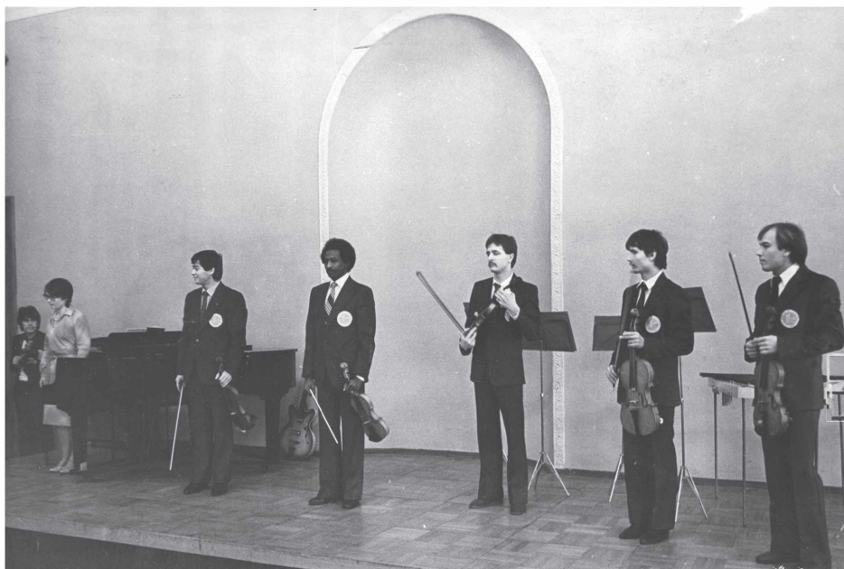
Ансамбль скрипачей на концерте в Камерном зале института