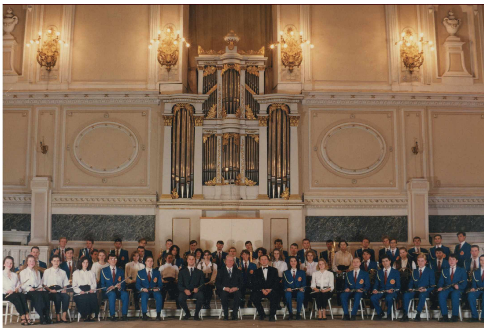
Духовой оркестр после концерта в зале Петербургской Капеллы