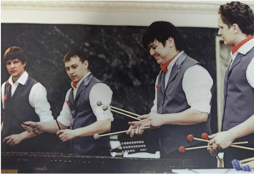
На маримбе вчетвером... Так исполнялся в оригинальном переложении «Мексиканский танец» Ф. Партичелла