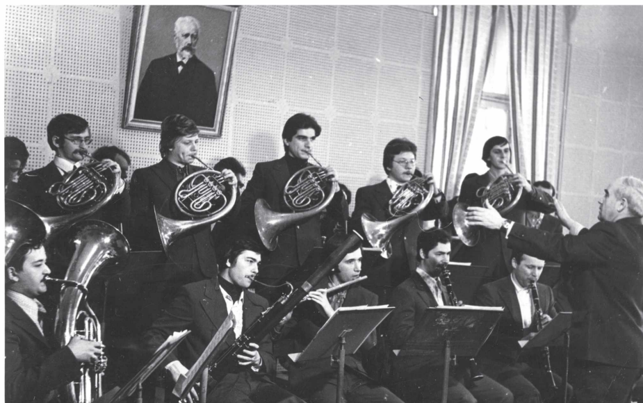
Занятия оркестрового класса